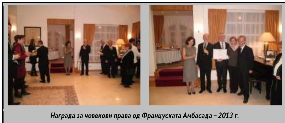
Награда за човекови права од Француската Амбасада – 2013 г.

на 10 декември 1948 година од страна на земјите членки на Обединетите нации, на Здружението за Заштита на правата на детето свечено му беше врачена Наградата за човекови права од Амбасадата на Франција во Скопје за 2013 година , чија тема за првото издание на оваа награда е борба против исклучување (борба против дискриминација – борба против екстремната сиромаштија – борба за правата на малцинствата). Наградата е „ во чест на одличната работа на терен, ден по ден, со храброст и упорност од страна на сите членови на оваа асоцијација со најсиромашните и најранливите деца “.