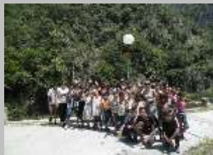
Матка 2013 г.