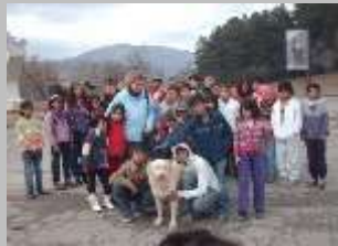
Кушево, јануари 2011 г.