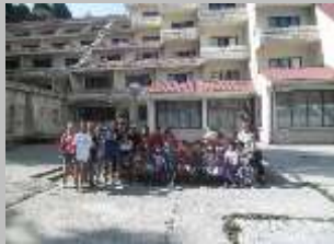
Пелистер, 2013 г.