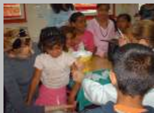
Имунизација и систематски прегледи