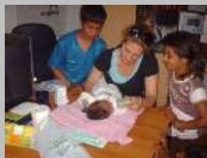
Се грижиме и за најмалите членови