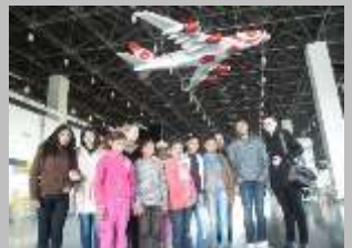
Аеродром „Александар Велики“, 2013 г