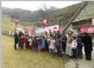
с.Маврово декември 2011 г.