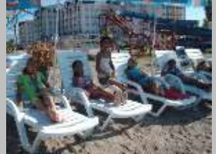
летување во Струга 2012 г.