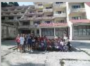
Пелистер, 2013 г.