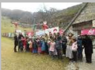
с.Маврово декември 2011 г.