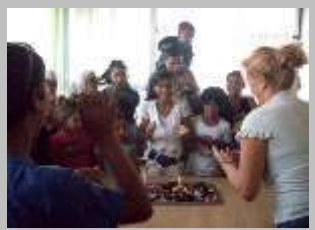
Добиваме оброк и прославуваме родендени