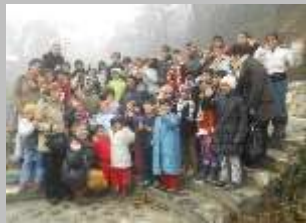
с.Вруток декември, 2011 г.