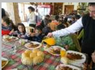
Ресторан „Делфина“, с.Маврово 2011 г.