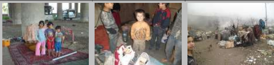
Посета на семејствата во нивните домови