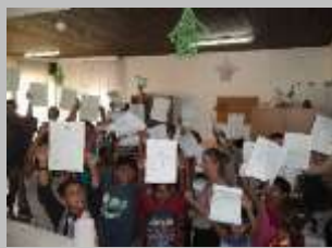
Вклучување во образовниот систем: Се радуваме и ја прославуваме успешно завршената учебна година