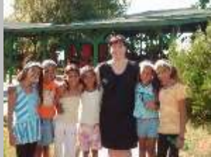
летување во Струга 2012 г.