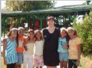
летување во Струга 2012 г.