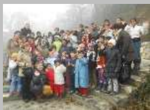
с.Вруток декември, 2011 г.