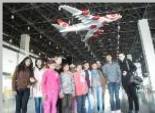
Аеродром „Александар Велики“, 2013 г