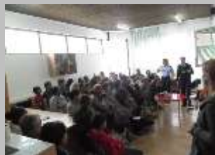
Едукација на родителите за правата на детето и родителски средби