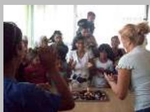
Добиваме оброк и прославуваме родендени