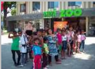
Зоолошка градина 2013