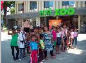
Зоолошка градина 2013