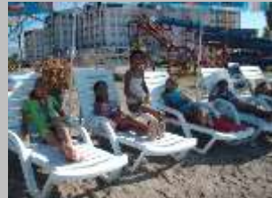
летување во Струга 2012 г.