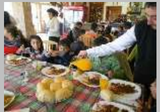
Ресторан „Делфина“, с.Маврово 2011 г.