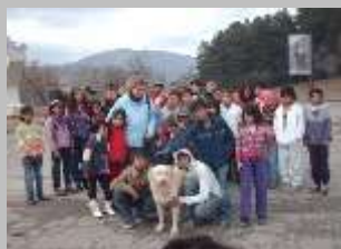
Кушево, јануари 2011 г.